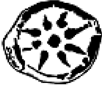
Illustration de la bourse de la veuve